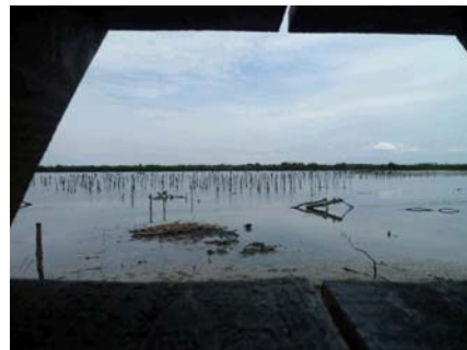
Vue d'un observatoire.