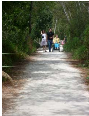
Sur le chemin du parc du Teich, accessible !