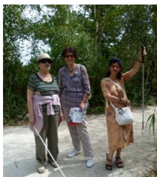
Les stars d'Ener'gihp !