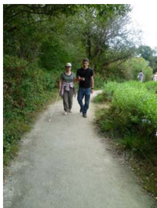
Jeune JVC en pleine action !