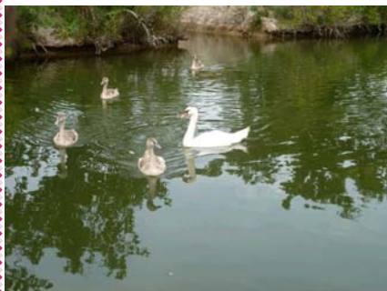
Le paradis des cygnes.

Août 2011, 2 sorties avec accompagnement d'Ener'gihp Au parc ornithologique du Teich Descente de la Leyre