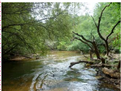
La Leyre, ambiance mangrove.